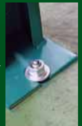
ねじ部損傷もなく 打ち損じもない

L型ヘッドが360°自由に動くため、 コーナー部分や空間の狭い箇所の 施工に最適 (SD-308R-LH)