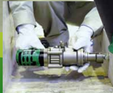
狭い場所でも施工可能