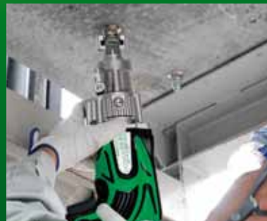
天井もらくらく施工