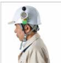
ヘルメットに取付け

特徴 5 ①カラビナ、②吊り下げ用アタッチメント、③ヘルメット取付用電池蓋、④三脚取付用電池蓋、⑤ネックストラップ、⑥ドライバー 付きでいろいろなスタイルで携帯可能