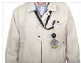
作業服の胸ポケットに取付け