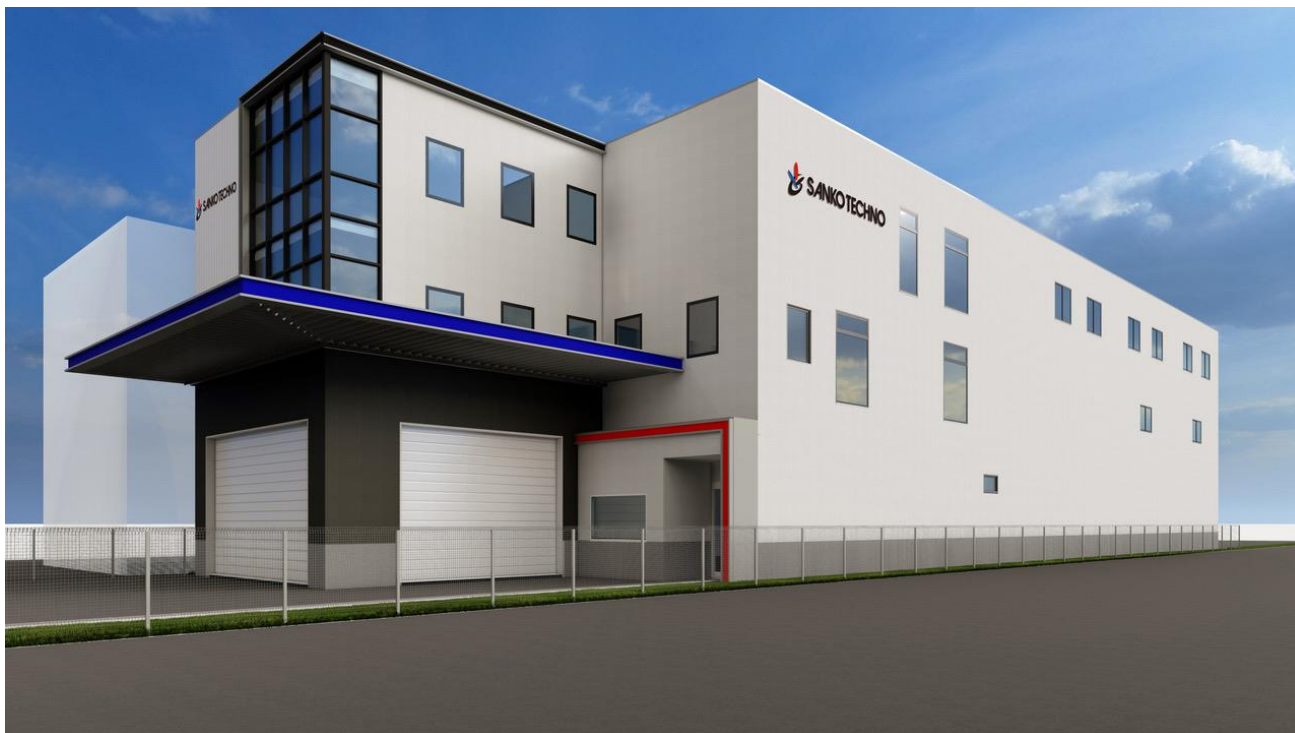
大阪支社 社屋完成イメージ